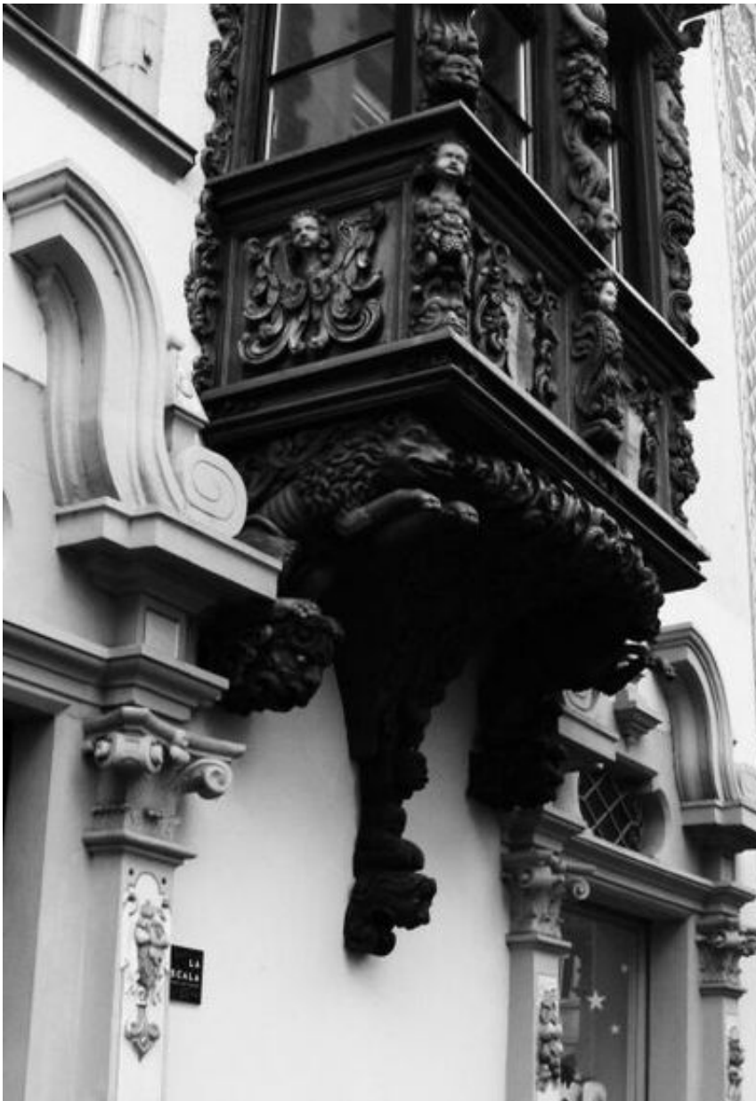
Erker am Boul'schen Haus

Eine besondere Zierde, die in ihren Einzelheiten viel zuwenig gewürdigt wird, bildet der zweigeschossige Erker . Er ist vielleicht der älteste der drei bemerkenswerten Erker an der Hauptstrasse 35. Während die beiden andern (Haus Brugger und Haus Dr. Weder) religiöse Motive enthalten, stellt der Buolsche einen typischen Kaufmannserker dar. Man kennt weder den Künstler noch die genaue Zeit der Ausführung. Vielleicht arbeitete hier der gleiche unbekannte Meister wie beim Erker zum «Greif» in St. Gallen. Der kastenförmige, aus der Mauerflucht ragende, erhöhte Vorbau erhellt und erweitert den hinter ihm liegenden Wohnraum. Von diesem Beobachtungsposten aus liess sich das Treiben auf der Strasse z. B. bei Festlichkeiten bequem verfolgen. Es könnte sein, dass die Buol, zu Wohlstand gekommen, mit der reichen und humorvoll-ernsten Ornamentik ihres Erkers ihrem Friedensjubel nach dem Dreissigjährigen Krieg Ausdruck gaben. Auf jeden Fall stellt das Werk ihrem Kunstsinn ein feines Zeugnis aus. Das gleiche gilt für den Erneuerer Karl Weber, der dem Kleinod durch die Farbgebung des von ihm verehrten Künstlers Theo Glinz 1927 erhöhte Wirkung und Schönheit verleihen liess. Der gleiche Künstler schuf 1953 auf der grossflächigen Fassade des untern Hauses den Paradiesgarten in eindrucksvollem Sgraffito.